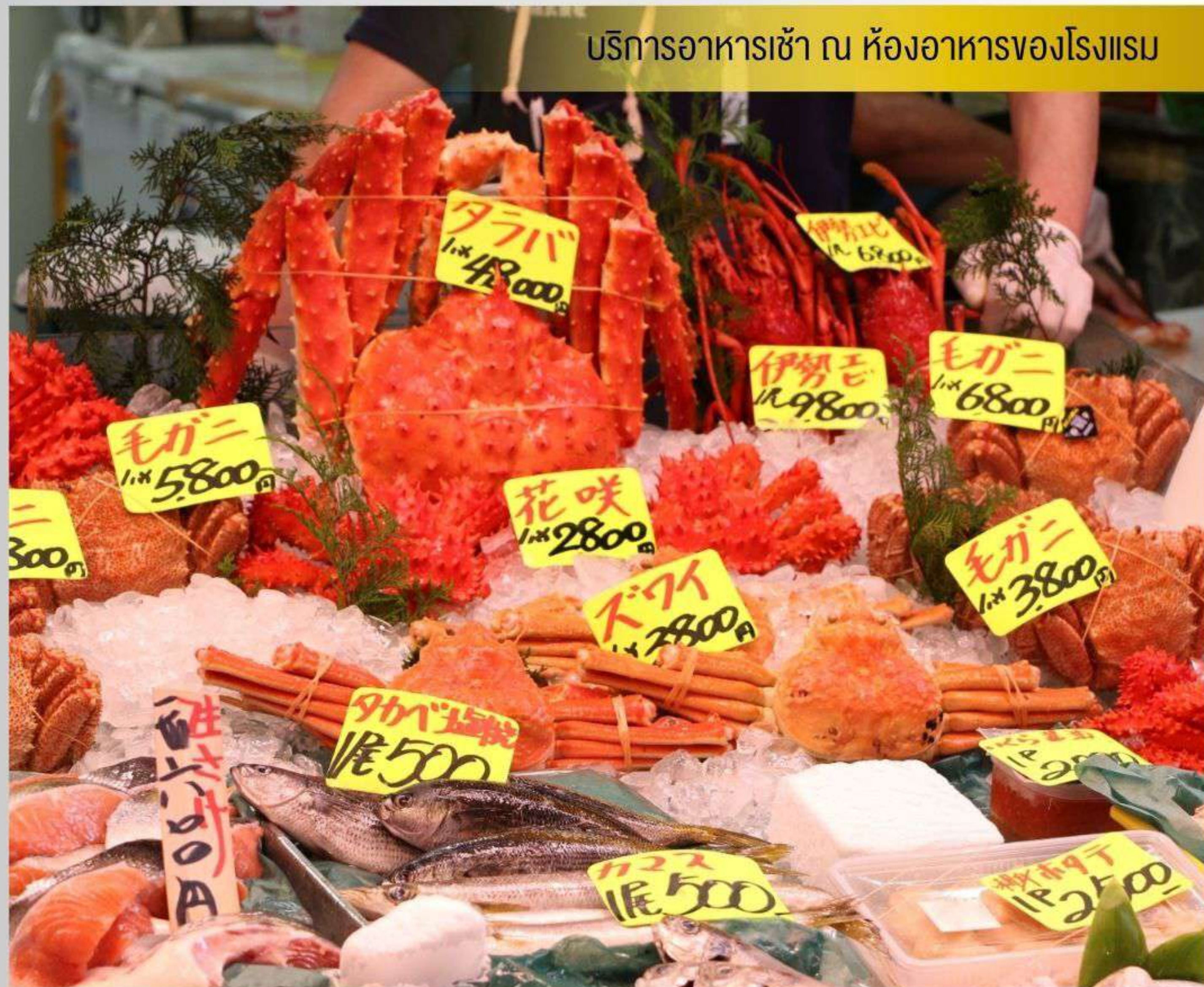
บริการอาหารเช้า ณ ห้องอาหารของโรงแรม