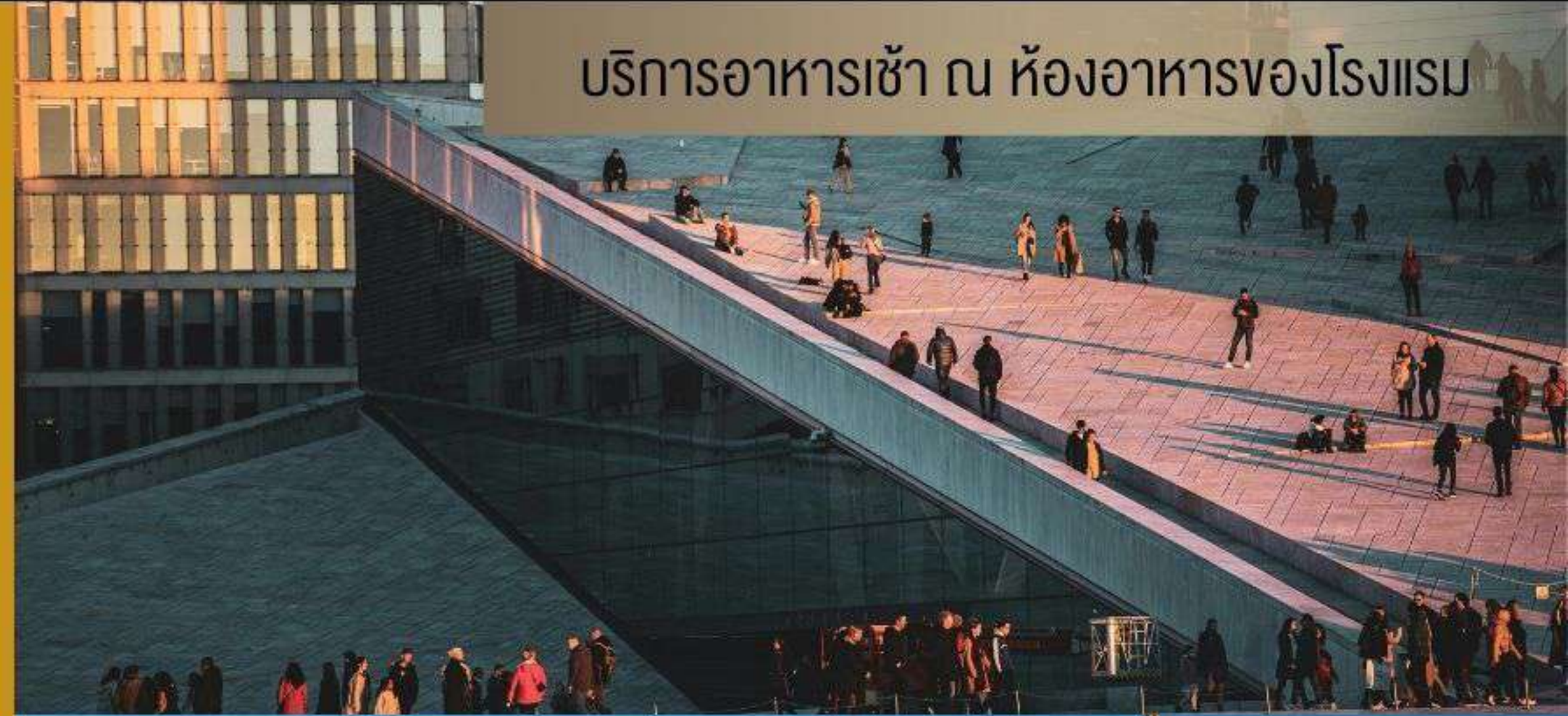
บริการอาหารเช้า ณ ห้องอาหารของโรงแรม

เปิดประสบการณ์สุดพิเศษ ณ เมืองออสโล ชมด้านนอก ออสโล โอเปร่าเฮาส์ เป็นโรงละครซึ่งเป็นสัญลักษณ์ของเมืองออสโล แลนด์มาร์คที่โดดเด่น จากนั้นแวะเก็บภาพ ป้อมปราการอาครส์ฮูส เป็นปราสาท ป้อมปราการยุคกลาง ที่ถูกสร้างขึ้นเพื่อปกป้องเมืองออสโล จากนั้นถ่ายรูปกับ พระราชวังหลวงออสโล ที่มีอายุเก่าแก่หลายร้อยปี ปัจจุบันยังคงเป็นที่ประทับอย่างเป็นทางการของ กษัตริย์นอร์เวย์องค์ปัจจุบัน และเยี่ยมชมด้านนอก ศาลาว่าการกรุงออสโล เป็นศาลาว่าการกรุงเก่า ตั้งอยู่ริมน้ำ มีสถาปัตยกรรมที่โดดเด่น