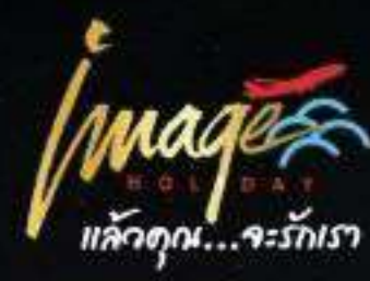
IMAGE EXCLUSIVE AURORA HUNTING IN NORWAY 10D 7N

กำหนดการเดินทาง : วันที่ 13-22 พ.ย. 2569 // 24 ธ.ค. 2569 - 2 ม.ค. 2570 // 22-31 ม.ค. 2570 // 12-22 ก.พ. 2570