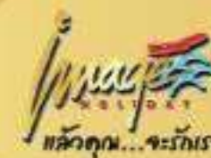
IMAGE HOLIDAY (THAILAND) CO.,LTD 193/152 12th Fl., Lake Ratjada Tower, Ratjadapisek Rd., Klongtoey Bangkok 10110