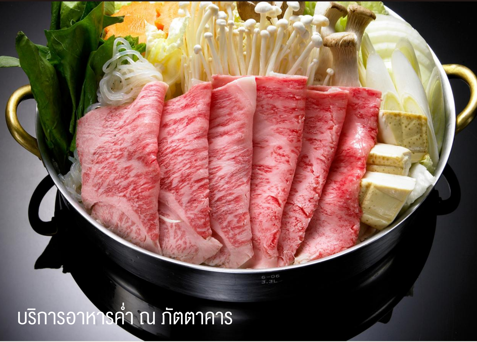
บริการอาหารค่ำ ณ ภัตตาคาร

ทาคายาม่า • ตลาดเช้า • ย่านเมืองเก่า • ฮาคุบะ