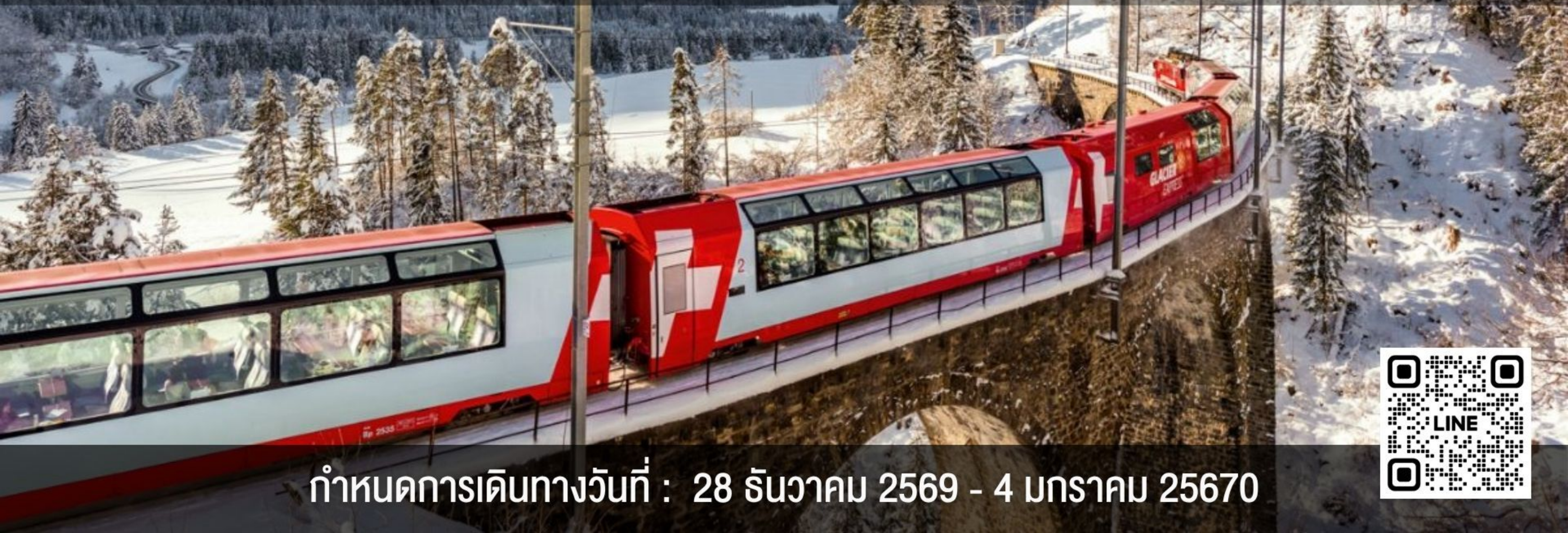
IMAGE GRAND SWITZERLAND NEWYEAR 8D5N

กำหนดการเดินทางวันที่ : 28 ธันวาคม 2569 - 4 มกราคม 25670